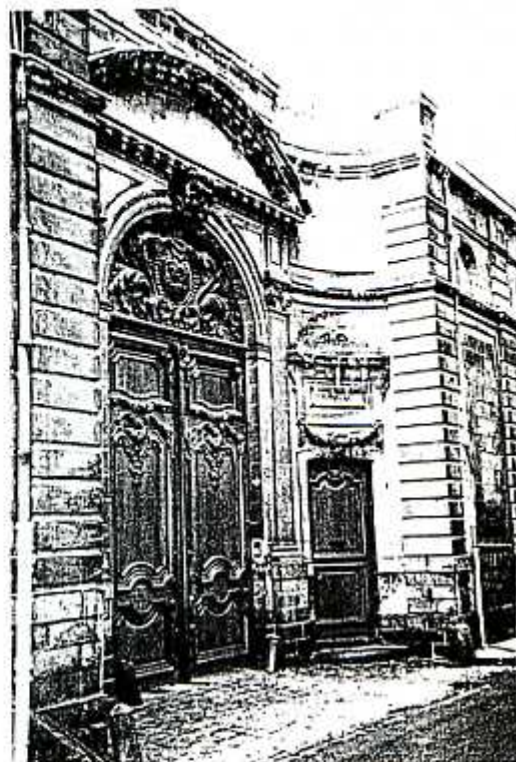
Rue des Jongleurs à ARRAS, l'Hôtel du Duc de Guines dernier gouverneur de L'Artois. (Construit en 1738)

L'Arbr peut vous envoyer une copie intégrale du texte original de 83 pages, plus quelques notes en annexe sur l'histoire des États d'Artois (100 F, port compris)