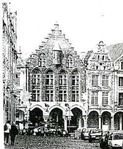
L'Hôtel des 3 Luppars, la plus ancienne des maisons d'Arras

Dimanche 20 OCTOBRE 1996 dès 10 H. à ARRAS Hôtel des Trois Luppars (49 Gd Place)