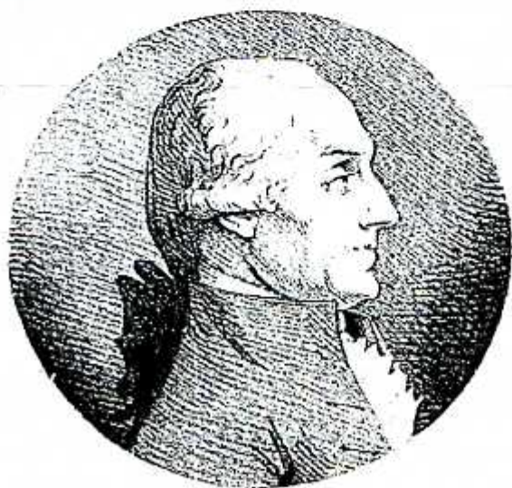
Charles Payen. Coll. D, lithographie collée et pressée en forme de gravure (Arch. dép. Pas-de-Calais, coll. Barbier 472/72).

(3) Bon BRIOIS DE BEAUMETZ , président du Conseil d'Artois, hostile à Robespierre, fut le premier élu de la Noblesse d'Artois aux États Généraux. Il présida l'Assemblée Nationale, s'affichant comme libéral, "de centre gauche", opposé à la nationalisation des biens du clergé. Il émigra aux Indes en 1792 où on suppose qu'il mourut vers 1800) Les 3 autres nobles élus furent le Comte Charles LAMETH , LE SERGEANT D'ISBERGUE et le Comte de CROIX