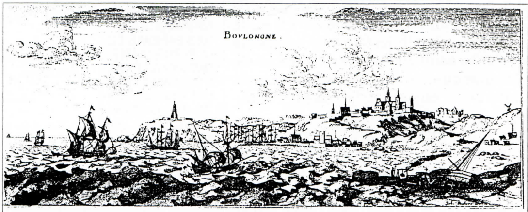
En 1789 80% des bateaux arrivant à Boulogne sont des "smoggers" (contrebandiers anglais)