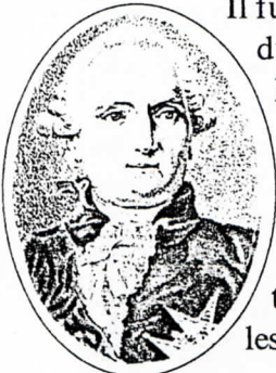
Le comte Vergennes

principales préoccupations de Robespierre tout au long de sa "campagne électorale" de 1788-89. Il le démontrera notamment dans son "Adresse à la Nation Artésienne"