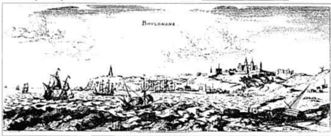
En 1789 80% des bateaux arrivant à Boulogne sont des "smoggers" (contrebandiers anglais)

principales préoccupations de Robespierre tout au long de sa "campagne électorale" de 1788-89. Il le démontrera notamment dans son "Adresse à la Nation Artésienne"