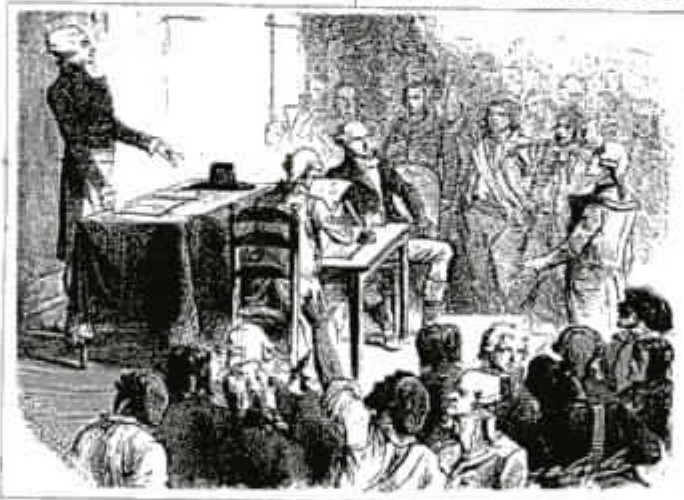
Robespierre aux Jacobins