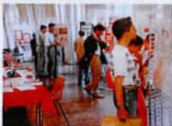
1989 : exposition à Arras « Robespierre, connais pas? »

Dès sa création l'ARBR s'est mobilisée pour que la ville achète la maison de Robespierre puis pour qu'elle soit restaurée. Elle a ensuite fait de la maison des Carrault, (leurs-grands-parents) un autre lieu de la mémoire des Robespierre à Arras.