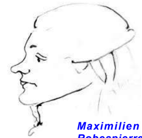
Maximilien Robespierre croqué par Gros en 1794