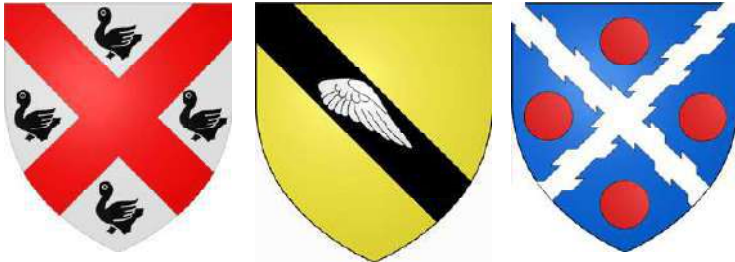
3 blasons attribués à la famille (de) Robespierre : 1) Willaume au XV° 2) Yves au XVIII° 3) selon glossaire canadien