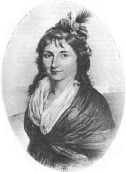
Charlotte Robespierre lithographie parue à sa mort en 1834