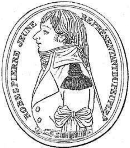
Augustin-Bon Robespierre d'après une médaille frappée à l'occasion de la reprise de Toulon sur les Anglais. en 1793