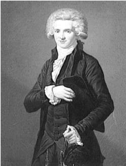
Maximilien Robespierre jeune Avocat à Arras