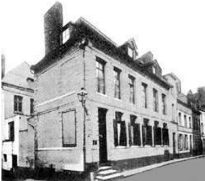
La dernière maison où logea Maximilien Robespierre à Arras, rue des Rapporteurs.