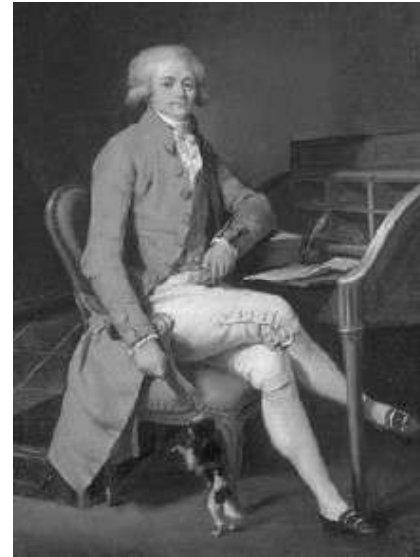
Maximilien Robespierre Député aux Etats-Généraux, à la Constituante puis à la Convention Nationale entre 1790 et 1794